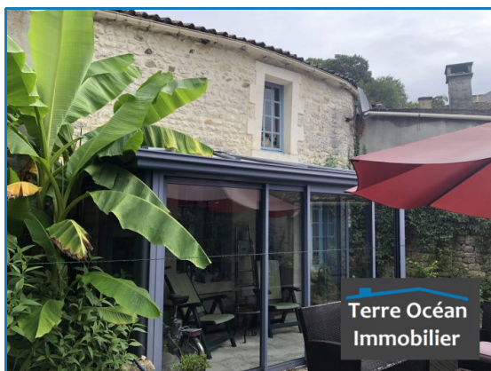
Coup de cœur

Référence TJXC07, Mandat N°105 Pour plus de renseignements sur cette annonce, merci de contacter le 06.37.07.87.27